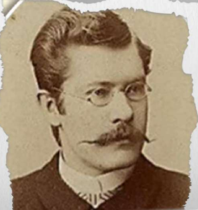
Stalta auguma, cēlu gaitu, arvien paceltu galvu, 22–23 gadu vecumā Koknesē uzturas R. Blaumanis.

139 gadi pagājuši kopš R. Blaumaņa laikiem Koknesē. Joprojām no paaudzes uz paaudzi tiek nodoti stāsti par Alaines muižas dzīvi, par cilvēkiem, kas šeit dzīvojuši. Dzīves laiks Koknesē un tās skaistā daba veicina R. Blaumaņa, dzejnieka un rakstnieka, talanta attīstību. Te pēc piecu gadu klusēšanas viņš atsāk strādāt rakstniecībā. Daudz ūdeņu aiztecējis, daudz pārvērtību noticis šajā laikā Koknesē. Dodoties maršrutā, kā tāli atspulgi saskatāmas vietas, kuras reiz skatījušas rakstnieka vērojošās acis.