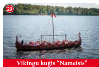
Vikingu kuģis "Nameisis"

Saimniecība, kas piedāvā aktīvo atpūtu ar iepriekšēju rezervāciju: enduro takas, zirgu izjādes, motociklu noma, kempinga vietas. "Rosmes", Bebru pagasts, Aizkraukles novads +371 26246830 📍 56.747301516858826, 25.50154209136963