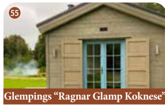
Glempings "Ragnar Glamp Koknese"

+371 29578899 www.divasupes.com "Rozes", Bilstiņi, Kokneses pagasts, Aizkraukles novads 📍 56.640088, 25.410089