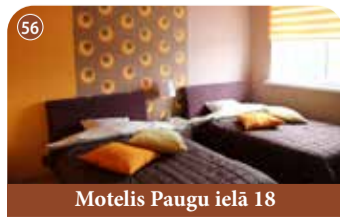
Motelis Paugu ielā 18

+371 29578899 www.ragnarglamp.com Jaunbilstiņi, Kokneses pagasts, Aizkraukles novads 📍 56.640088, 25.410089