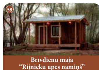
Brīvdienu māja "Rijnieku upes namiņš"

+371 25434818 www.cieminos.lv "Kalniņi", Bebru pagasts, Aizkraukles novads 📍 56.747450, 25.420235