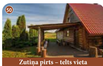
Zutiņa pirts - telts vieta

+371 26567971 www.vecbordzeni.viss.lv Vecbordzēni, Viskāļi, Kokneses pagasts, Aizkraukles novads 📍 56.708232, 25.285397