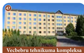
Vecbebru tehnikuma kompleksa dienesta viesnīca

+371 65161994 1905. gada iela 14A, Koknese, Aizkraukles novads 📍 56.6453032, 25.4362523