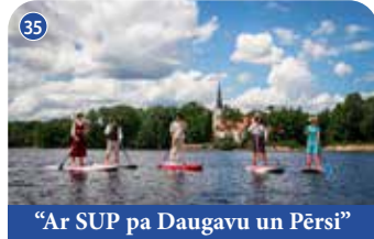
"Ar SUP pa Daugavu un Pērsi"

Vikingu tipa kuģītis piedāvā braucienus un kapteiņa stāstījumu maršrutā Kokneses pilsdrupas–Pērses upe–Likteņdārzs–Kokneses pilsdrupas. Uz kuģa ir 19 vietas. Iepriekšēja pieteikšanās. +371 26161131 📍 56.63853067, 25.4174602