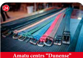
Amatu centrs "Dunense"

un sagatavotības līmenim. Misija Koknese ir paredzēta 6–30 cilvēku grupai. Ja gribi doties šajā aizraujošajā piedzīvojumā, piesaki savu komandu iepriekš. Lai pildītu misiju, nepieciešams laika apstākļiem un staigāšanai piemērots apģērbs. Līdzī jņam arī viedtālrunis vai fotoaparāts! Biedriba "Pērses krasts" "Pērses", Koknese, Kokneses pagasts, Aizkraukles novads +371 29119882 📍 56.6436914, 25.4109527