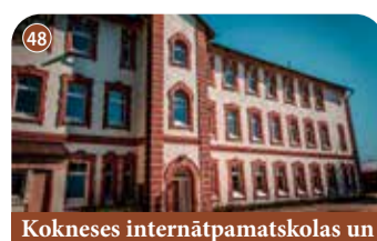
Kokneses internātpamatskolas un attīstības centra dienesta viesnīca

+371 26593960 Vecbebru, Bebru pagasts, Aizkraukles novads 📍 56.723645, 25.478488