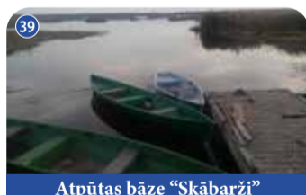
Atpūtas bāze "Skābarži"

Iznomā 15 dažādas laivas makšķerēšanai un izklaidei, kā arī tirgo makšķerēšanas licences. Pieejamas telšu un ugunsкура vietas, naktsmītnes. "Vecbordzēni", Kokneses pagasts, Aizkraukles novads +371 26567971 www.garausi.viss.lv 📍 56.708232, 25.285397