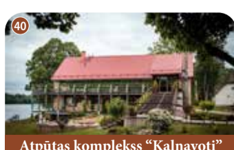
Atpūtas komplekss "Kalnavoti"

+371 29357420 "Kalnavoti", Kokneses pagasts, Aizkraukles novads 📍 56.621448, 25.462894