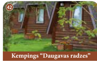
Kempings "Daugavas radzes"

+371 26593210 "Sidrabi", Kokneses pagasts, Aizkraukles novads 📍 56.611562, 25.497367