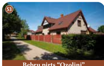
Bebru pirts "Ozoliņi"

+371 29182926 Bormaņi, Kokneses pagasts, Aizkraukles novads 📍 56.676292, 25.482927