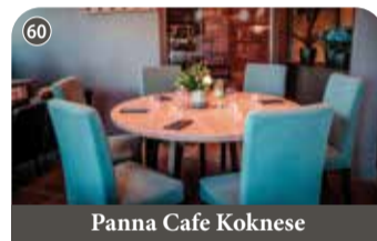
Panna Cafe Koknese

+ 371 26398193 Blaumaņa 30A, Koknese, Aizkraukles novads