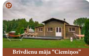
Brīvdienu māja "Ciemīņos"

+371 29435631 Daugavas iela 17, Koknese, Aizkraukles novads 📍 56.643789, 25.415534