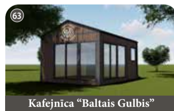
Kafejnīca "Baltais Gulbis"

Grilētu ēdienu vakariņas. Vēlams iepriekšēja pieteikšanās. +371 29578899 "Rozes", Bilstiņi, Kokneses pagasts, Aizkraukles novads 📍 56.640088, 25.410089