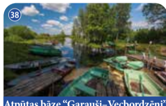
Atpūtas bāze "Garauši-Vecbordzēni"

Iznomā 15 dažādas laivas makšķerēšanai un izklaidei, kā arī tirgo makšķerēšanas licences. Pieejamas telšu un ugunsкура vietas, naktsmītnes. "Vecbordzēni", Kokneses pagasts, Aizkraukles novads +371 26567971 www.garausi.viss.lv 📍 56.708232, 25.285397