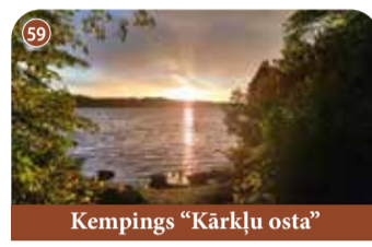
Kempings "Kārķļu osta"

+371 28105055 Rijnieki, Kokneses pagasts, Aizkraukles novads 📍 56.62888, 25.45337