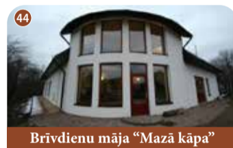
Brīvdienu māja "Mazā kāpa"

+371 29295900 Riekstukalni 1, Kokneses pagasts, Aizkraukles novads 📍 56.642273, 25.406168