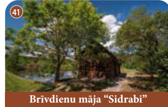
Brīvdienu māja "Sidrabi"

Z/S "Kalnavoti" iznomā 2 airu laivas, piedāvā pirts māju un naktsmītnes. "Kalnavoti", Kokneses pagasts, Aizkraukles novads +371 29357420 📍 56.621448, 25.462894 Laivu noma un atpūta pie Lobes ezera: