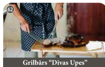
Grilbārs "Divas Upes"

+371 26514096 Blaumaņa iela 3, Koknese, Aizkraukles novads www.facebook.com/krodzinsrudolfs 📍 56.64339195, 25.42718589