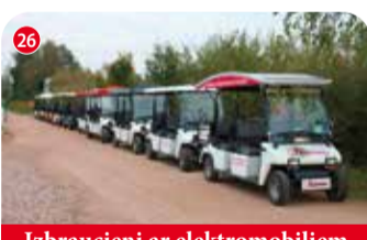
Izbraucieni ar elektromobiļiem

Bezrūpīgas brīvdienas vēsturiskajā Bilstiņu ciemā ar dievišķo creme brulee un izcilu kafiju. "Rīta putni", Bilstiņi, Kokneses pagasts, Aizkraukles novads +371 29147071, +371 29259572 www.ritaputni.lv 📍 56.6391917, 25.4055885