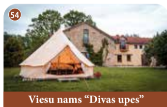
Viesu nams "Divas upes"

+371 29293877 "Ozoliņi", Bebru pagasts, Aizkraukles novads www.viesunamie.lv/bebru-pirts 📍 56.723133 25.489283