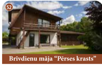
Brīvdienu māja "Pērses krasts"

+371 25227262 103.5. km Rīga-Daugavpils šoseja, Kokneses pagasts, Aizkraukles novads 📍 56.625495, 25.457871