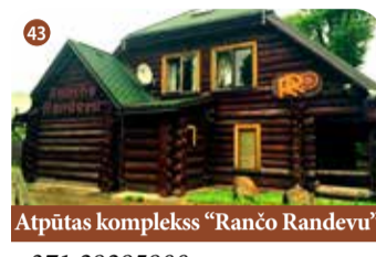
Atpūtas komplekss "Rančo Randevu"

+371 29284622 www.radzes.viss.lv "Radzes", Kokneses pagasts, Aizkraukles novads 📍 56.606788, 25.499882