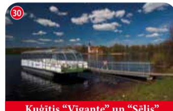
Kuģītis "Vigante" un "Sēlis"

Misija Koknesei ir aktīva atpūta ar sacensību elementiem. Sarežģītības pakāpes tiek pielāgotas dažādām paaudzēm