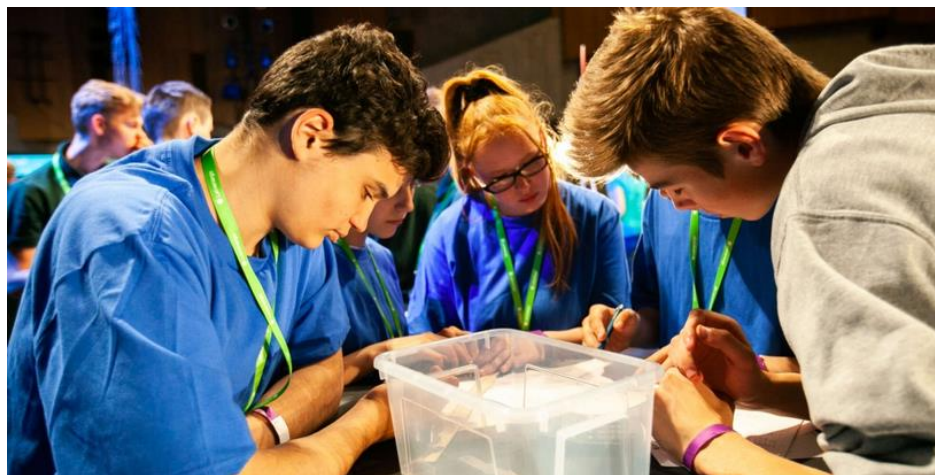
(Attēlam ir ilustratīva nozīme)

NELIELĀ PERSONU GRUPĀ, KAS IZVEIDOTĀ KĀDĀ NOTEIKTĀ UZDEVUMA VEIKŠANĀI. PERSONAS IR SAVSTARPĒJI ATKARĪGAS VIENA NO OTRAS, LAI SASNIEGTU KOPIĢU MĒRĶI.