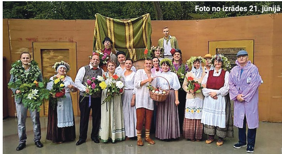
Foto no izrādes 21. jūnijā

21. jūnijā, tieši vasaras Saulgriežos, brīvdabas estrādē Ozolāji, novada ļaudis ielīgoja ar Rūdolfa Blaumaņa lugu "Skroderdienas Silmačos".