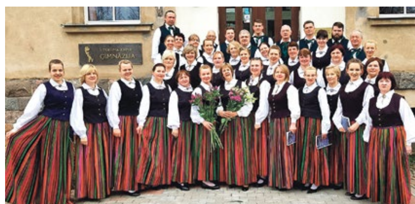
Jauktais koris “Kandava” pēc 2018.gada koku skates Tukumā