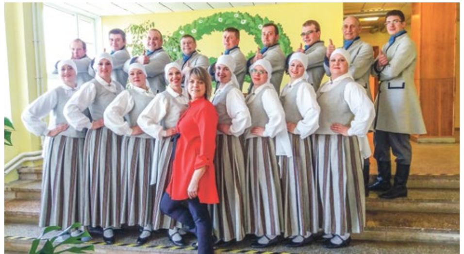
Zantes vidējās paaudzes deju kolektīvs