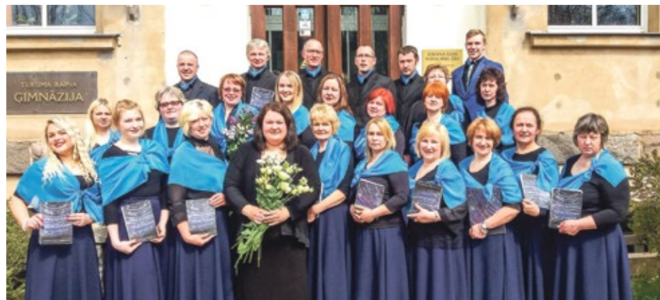
Zantes kultūras nama jauktais koris