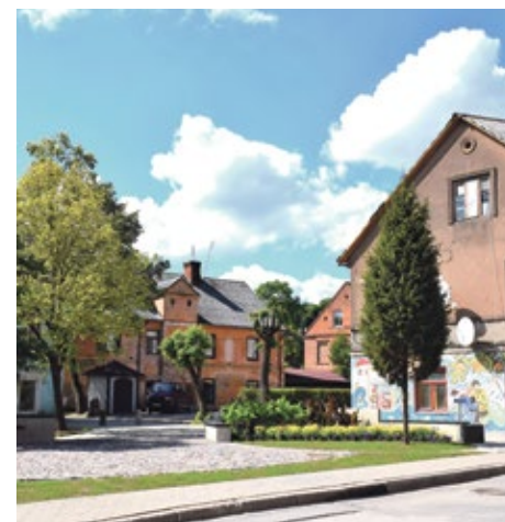
Skvērs Lielā ielā 23a pēc labiekārtošanas