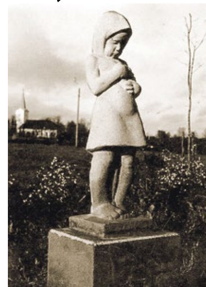
Skulptūra „Meitene ar puķi”

• 1934. gada 18. maijā dibina Kandavas kūrorta izbūves, izdaiļošanas un labierīcības biedrību. Tajā ir ap 40 biedru. Īsā laika sprīdī tās dalībnieki sakārto apkārtni Teteriņu priedēs, izvelkot un izkopjot celiņus, uztaisot tiltiņus un solus, kā arī izlabo veco dambi pie Teteriņu dzirnavām, līdz ar to