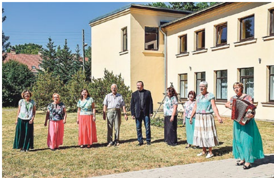
Ansamblis “Doremi” Valdeķu ciematīņa svētkos 2018. gada 9. jūnijā