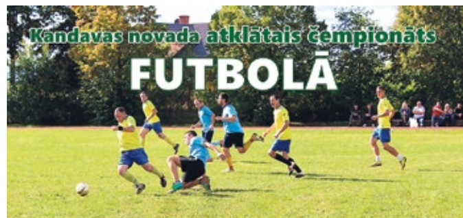
Jūlija pirmajā nedēļā sācies Kandavas novada atklātais čempionāts Futbolā. Sekojet informācijai par spēļu grafiku www.kandava.lv – sadaļā Sports.