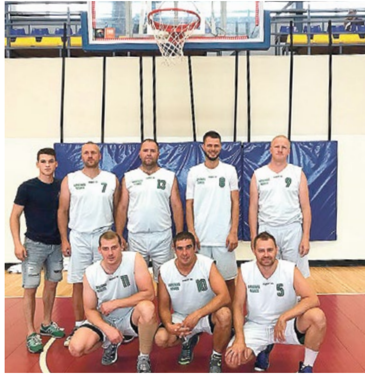
Kandavas veterānu basketbola komanda K35+

No 15. līdz 24. jūnijam norisinājās Latvijas Sporta veterānu – senioru savienības (LSVS) 55. sporta spēļu finālsacensības 24 vasaras sporta veidos.