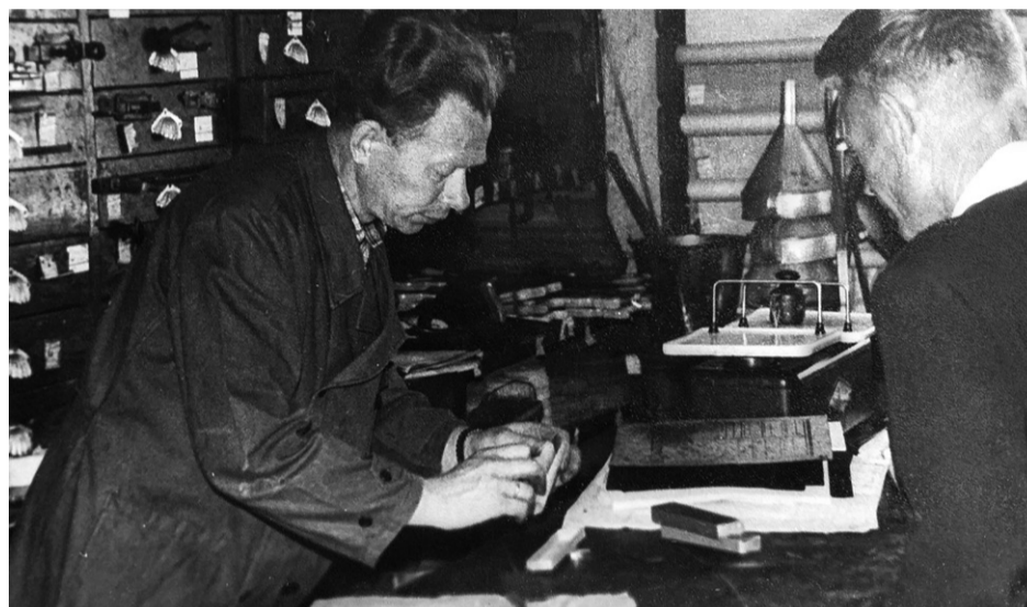
Tētis darbā veikalā

Sētā aiz loga krājās tukšā tara. Tās bija galvenokārt naglu kastes, gan jau vēl visādi skrūvju un citu dzelžu tara. Kastes bija jāsaplēš, jāizrauj visas naglas. Ar dēļiem kurināja apaļo bleķa krāsni. Vai varbūt tos dēļus arī kaut kur nodeva? Tas bija nebeidzams darbs.