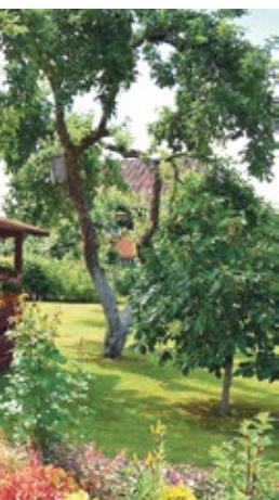
Kindzuļu ģimenes skaistais dārzs Vānes pagastā