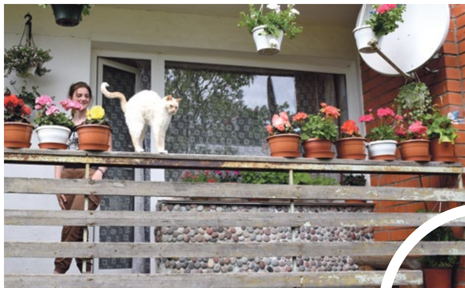
“Meldri-1” krāšņais balkons Matkulē ir draudzīgs mājdzīvniekiem

izmantojuši projektu naudu saimniecības attīstībai un tehnikas iegādei.