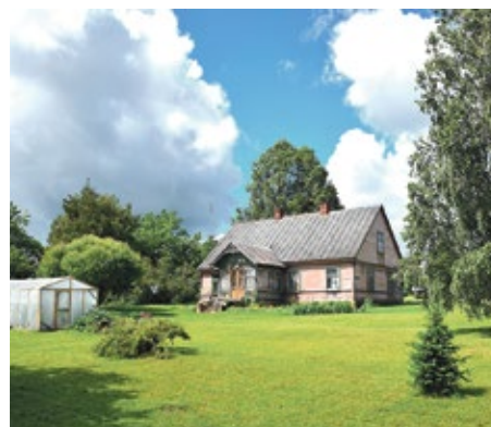
Pie Grenevičiem Cēres pagasta z/s “Auzukalni”