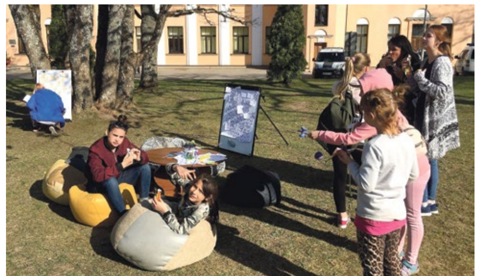
* Pasākuma laikā dalībnieki var tik filmēti un fotografēti, iegūtie video vai foto materiāli var tikt izmantoti pasākuma publikāciju sagatavošanai

Pasākuma mērķis – veicināt Kandavas novada jauniešu izpratni par mobilitātes iespējām Eiropā, iedrošinot viņus līdzdarboties un kļūt pilsoniski aktīviem, un mudināt izmantot Erasmus+ un Eiropas Solidaritātes korpusa programmu iespējas.