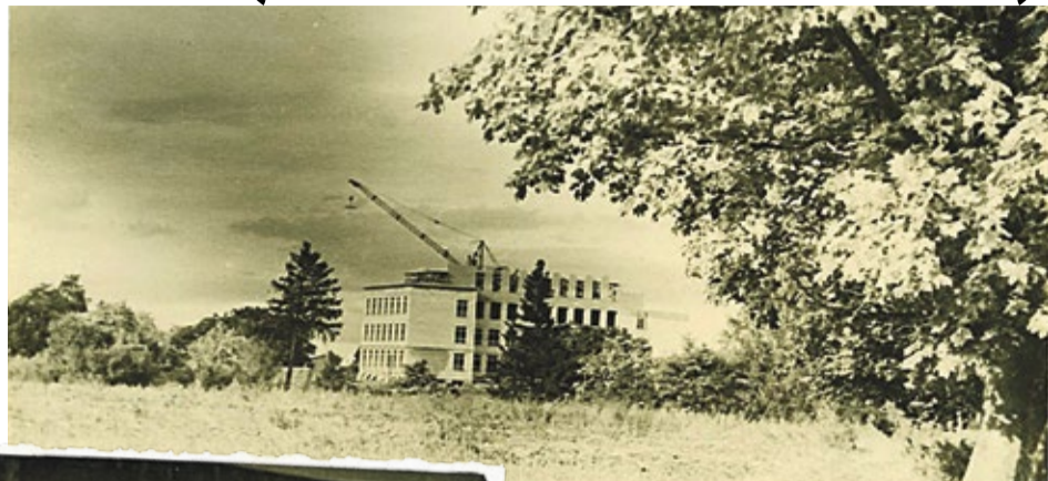
Kandavas internātskolas celtniecība