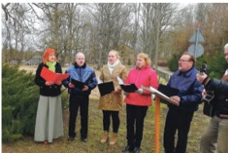
Dzied Matkules vokālais ansamblis

Kā pirmie piemiņas brīdi tieši pusdienas laikā pulcējās Matkules pagasta ļaudis.