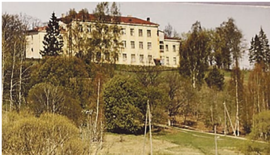
Kandavas vidusskolas vecā ēka

1954. gada 7. martā Kandavas rajona kultūras namā pulcējas pilsētas un tuvāko kolhožu darbaļaudis, lai atzīmētu Starptautisko sieviešu dienu. Ar referātu uzstājas LKP Kandavas rajona komitejas sekretāre