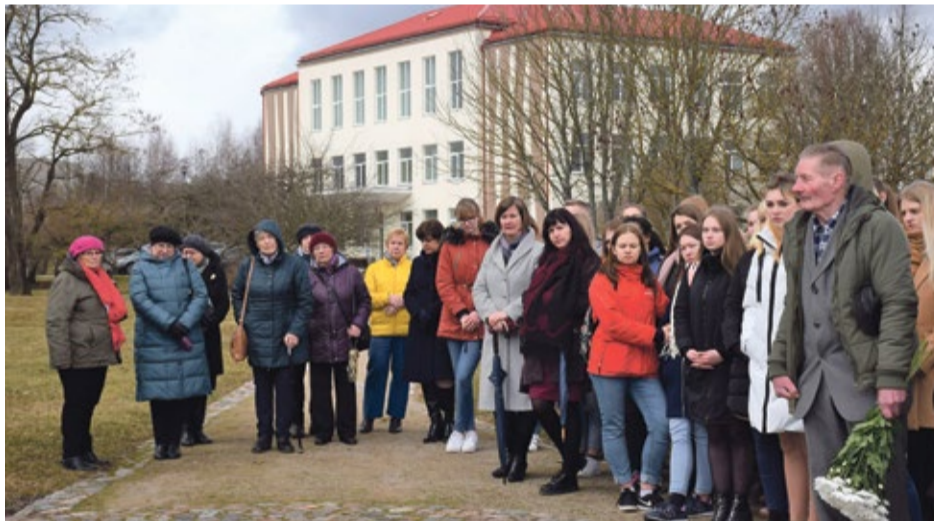
Pie represēto akmens Kandavā

Piemiņas brīdi Zantē tika pārrunāti un atgādāti šīs drūmās dienas vēstures fakti, skanēja dzeja un pieklusinātas melodijas, tika nolikti ziedi un aizdegts