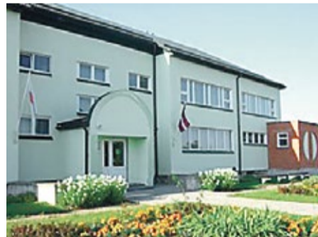
Zantes ģimenes atbalsta centrs

darbinieki, kliniskie psihologi, sociālie audzinātāji un citi profesionāļi. Mēs iestājamies par drošu bērniem – brīvu no fiziskas, emocionālas, seksuālas vardarbības un novārtā pamešanas. Mēs esam pārliecināti, ka vardarbība pret bērnu ir novēršama – ja vien rīkojamies preventīvi. Lai vardarbība pret bērniem notiktu, mēs izglītojam bērnus un jauniešus, vecākus dažādos projektos. Savukārt, ja vardarbība pret bērnu ir notikusi, mēs palīdzam to atklāt un sniedzam atbalstu: psiholoģiskā rehabilitācija bērnam; konsultācijas bērnam ģimenei, speciālistiem. Latvijas sabiedrībā joprojām vērojama visai augsta vardarbības tolerance – gan pieaugušo attieksmē pret bērniem, gan arī pašu bērnu vidū. Mūsaprāt, par bērnu drošību atbildīgs ir ikviens – no vecākiem līdz garāmgājējiem, no skolotājiem un ārstiem līdz ministriem. Mēs cenšamies panākt vienotu sabiedrības izpratni par vardarbības riskiem un pazīmēm, palīdzēt radīt vienotus rīcības algoritmus un savlaicīgu iesaisti, lai bērniem palīdzētu. Lai mainītu sabiedrības attieksmi, regulāri piedalāmies sociālās kampaņās, paūžam savu viedokli medijos, kā arī cenšamies aktīvi iestāties pret vardarbību politiskā līmenī.