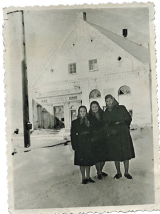
Kinoteātris „Spartaks” ap 1955. gadu, pirmā no kreisās Zibiņa.

Kalniņa. Noslēgumā kultūras nama dramatiskais kolektīvs skatītājus priecē ar R. Blaumaņa lugu „Ļaunais gars”