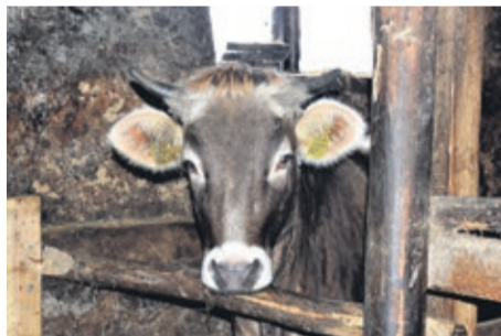
Jaunā telīte "Zīļu" ganāmpulkā