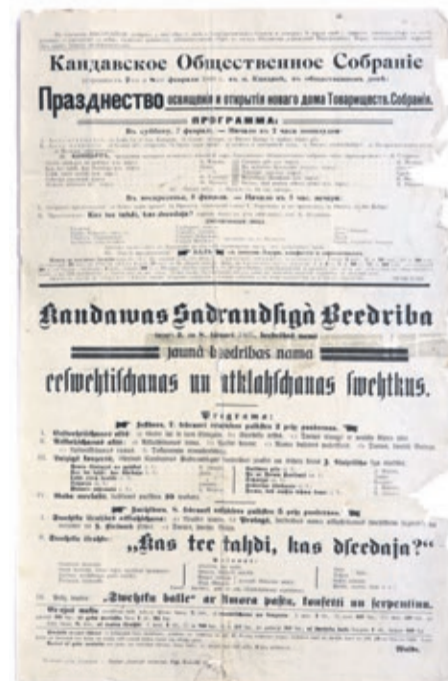
Atklāšanas pasākuma programma