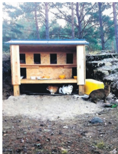
Kaķu māja Kandavā

Otra ir Kārļa Milēnbaha vidusskolas 10.–12. klašu skolēnu mācību motivācijas atbalsta programma, kurā par labiem mācību sasniegumiem skolēni tiek finansiāli