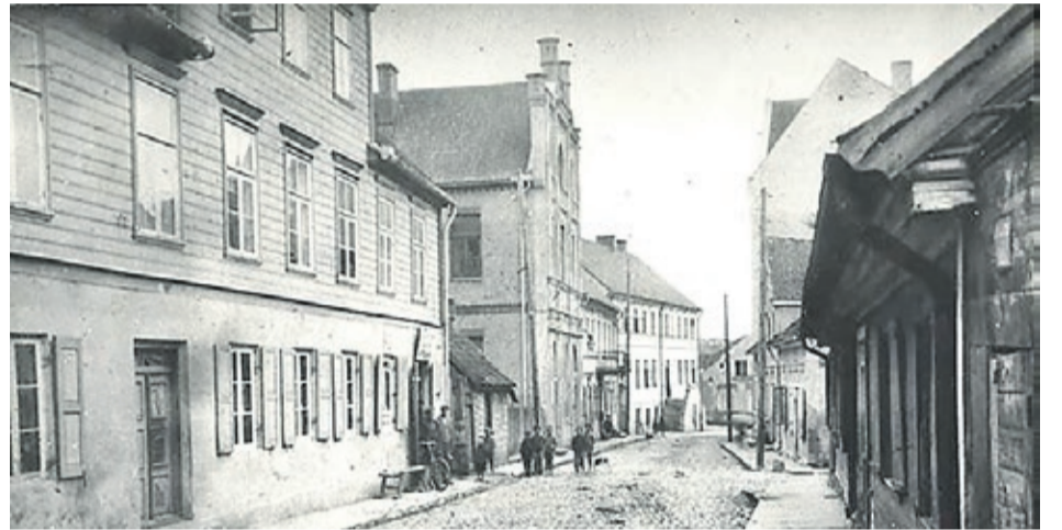
Sadraudzīgās biedrības namas 19. gs. 20. gadi

1902. gada 5. maijā vecāko padome nolēma uzsākt sarunas ar tirgotāju un namīpašnieku Meijeru Blumenavu par biedrības