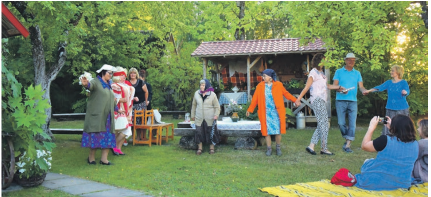
Brīvdabas izrāde „Indānos”

Katrā vietā ir labas domas, kuras var īstenot sabiedrība iesaistoties ar savu līdzdarbību un atbalstu. Iedzīvotājus aicinājām būt atvērtiem līdzdarbībai, ierosmēm un idejām, jo tikai no katra paša aktivitātes, ieinteresētības un spējas sevi motivēt brīvprātīgam darbam ir atkarīgs, kāda ir mūsu kopīgās dzīves telpas mikrovide. Sekojoši tam ar Kandavas novada domes finansiālu atbalstu un ziedojumu akcijās piesaistītiem līdzekļiem īstenojām mazo grantu projektu konkursu „Dari pats”, kura ietvaros atbalstījām septiņas iedzīvotāju iniciatīvas un veicinājām to realizāciju. Rezultātā tika veikti vides uzlabojumi Zemītes pagastā, sakārtojot informācijas stendus un izvietojot „pusceļa soliņus” pagasta teritorijā. Vānes pagastā tika sakārtota taka atpūtas parkā „Spāres” un ierīkots bērnu rotaļu laukums pie daudzdzīvokļu mājām. Matkules pagastā