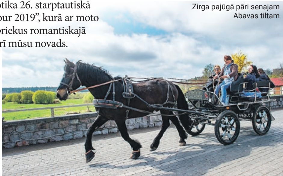
Zirga pajūgā pāri senajam Abavas tiltam

Kopš 2018. gada Kandavas vecpilsētas namu piecas sienas grezno latviešu autoru dzeja – kandavnieku dāvana Latvijai 100. jubilejā.