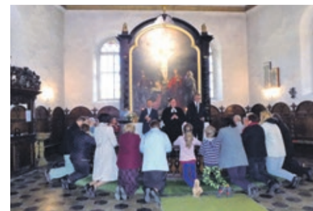
Pieteikties pie mācītāja pa tālr. 26547812.