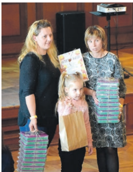
Spēles čaklāko zīļu vācējiem

Paldies visiem ziedotājiem, sponsoriem, atbalstītājiem, fonda dalībniekiem un brīvprātīgajiem palīgiem!