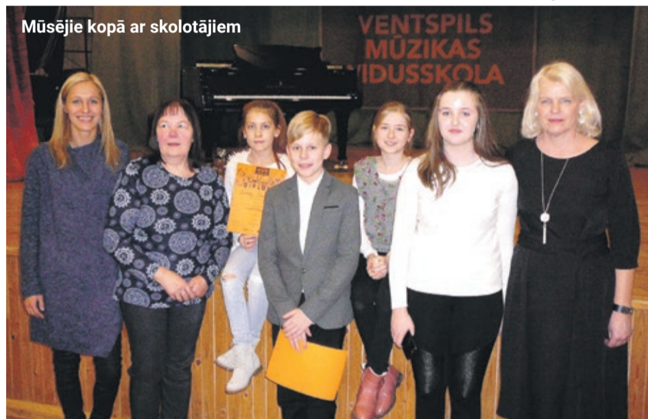
Mūsējie kopā ar skolotājiem

21. janvārī Ventspils Mūzikas vidusskolā norisinājās Latvijas profesionālās ievirzes mūzikas izglītības iestāžu Pūšamo instrumentu spēles audzēkņu Valsts konkursa II kārtā, kurā piedalījās 82 "pūtēji" no 12 Ziemeļkurzemes reģiona mūzikas skolām.